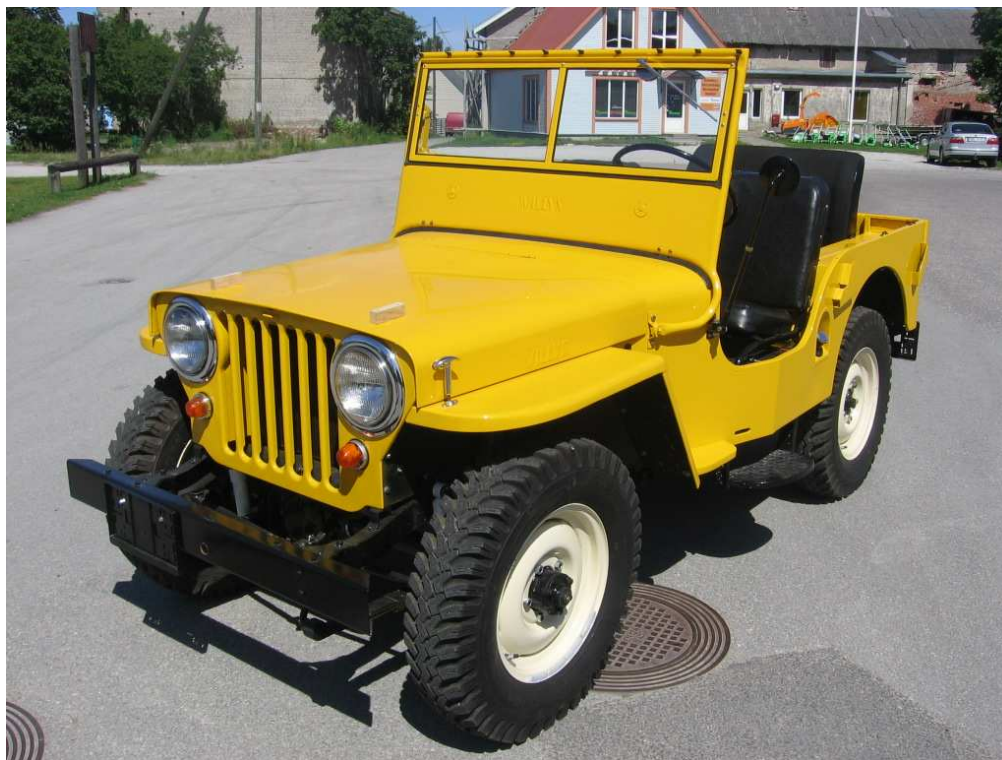
Diagonaalvaade esiosale ja vasakule küljele