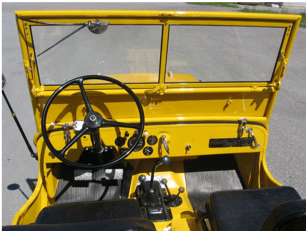
Vaade sõiduki armatuurlauale ja juhtimisseadmetele