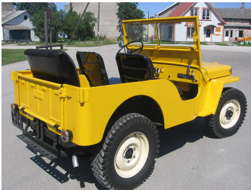
Diagonaalvaade tagaosale ja paremale küljele