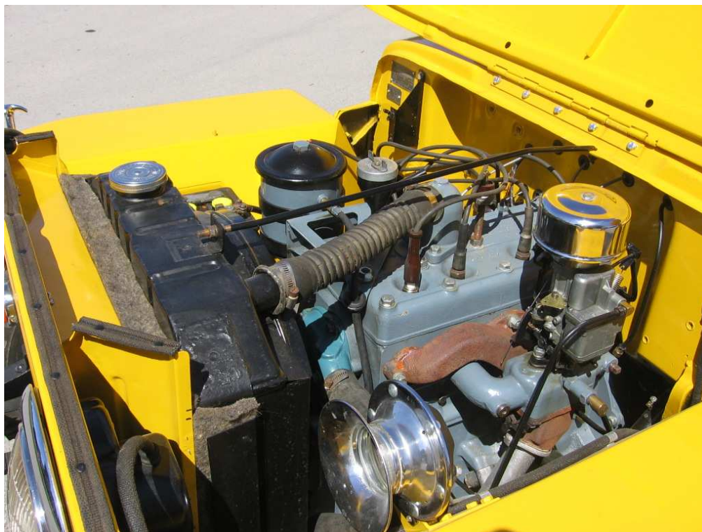
Vaade mootoriruumile vasakult või sõltuvalt mootoriruumi katte paigutusest muust suunast