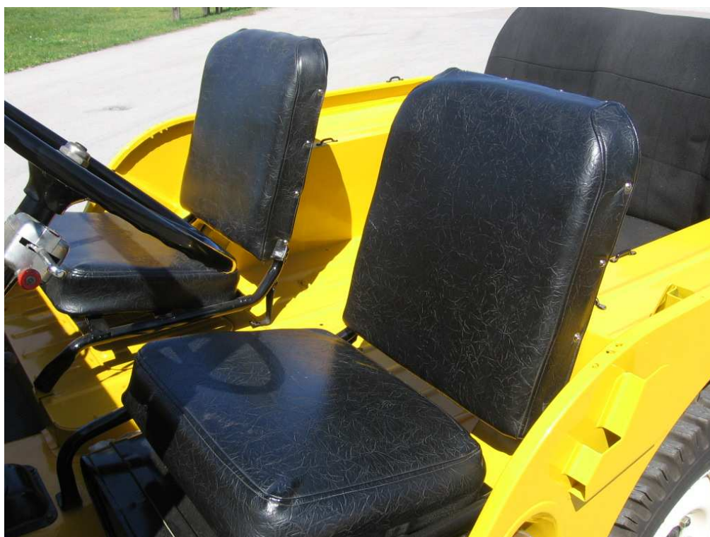
Vaade sõiduki istmetele (polsterdusele)