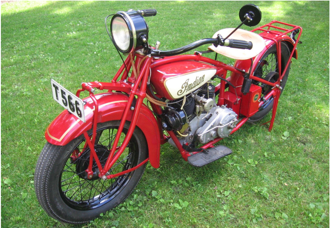
Diagonaalvaade esiosale ja vasakule küljele