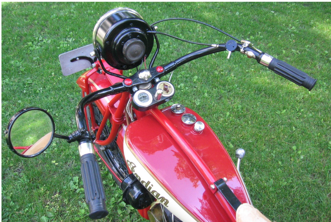
Vaade sõiduki juhtimisseadmetele