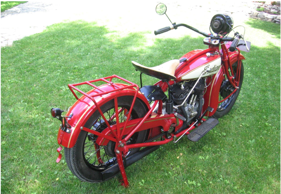
Diagonaalvaade tagaosale ja paremale küljele