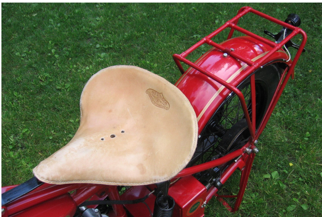
Vaade sõiduki istme(te)le