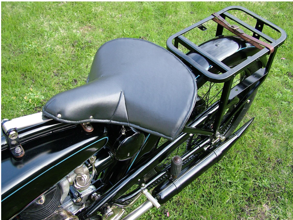
Vaade sõiduki istme(te)le