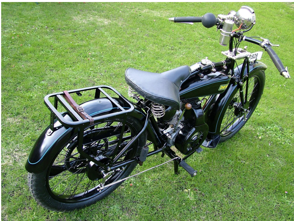
Diagonaalvaade tagaosale ja paremale küljele