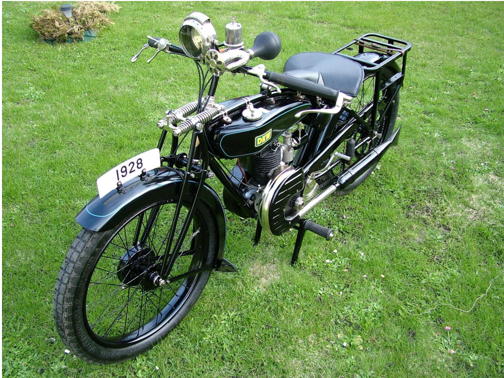
Diagonaalvaade esiosale ja vasakule küljele