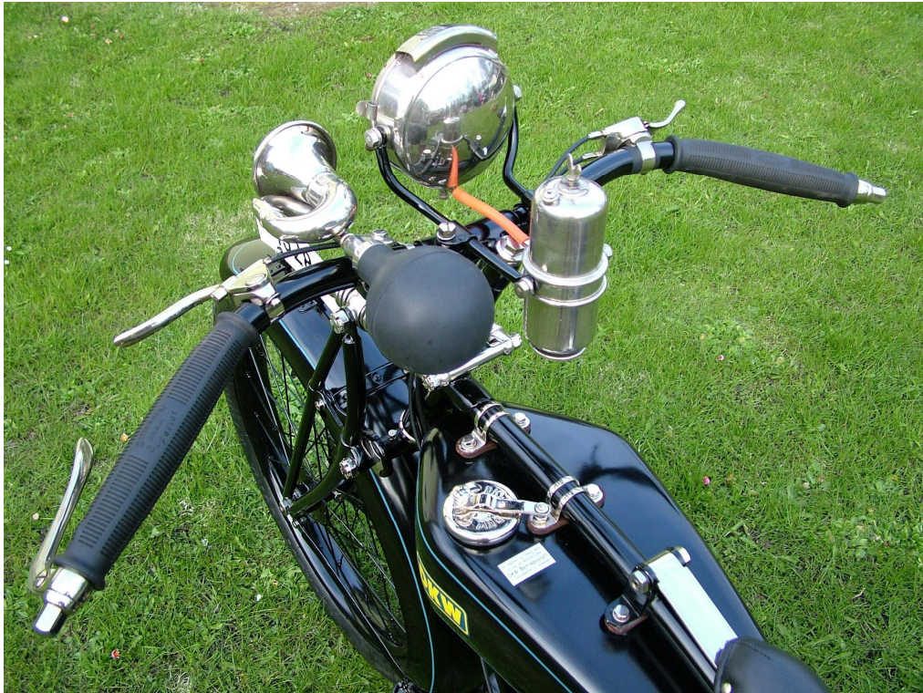
Vaade sõiduki juhtimisseadmetele