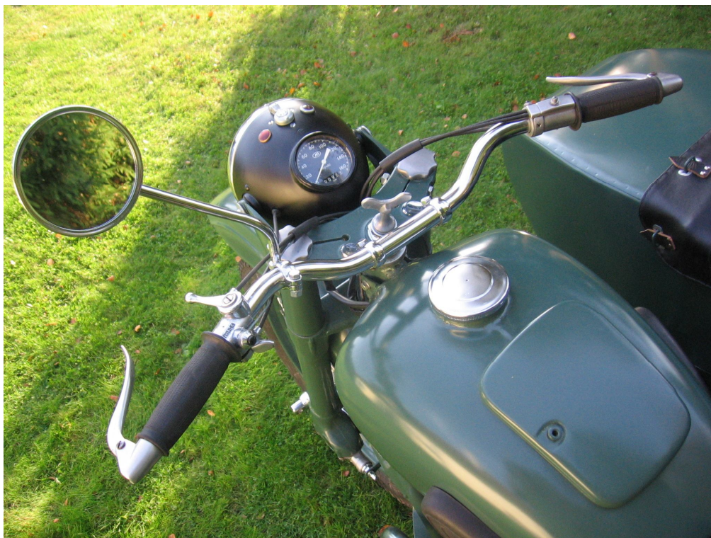
Vaade sõiduki juhtimisseadmetele