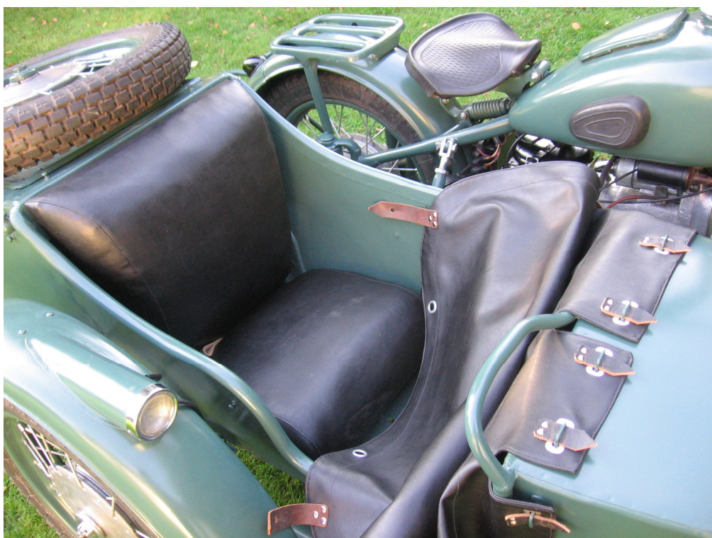
Vaade sõiduki istme(te)le