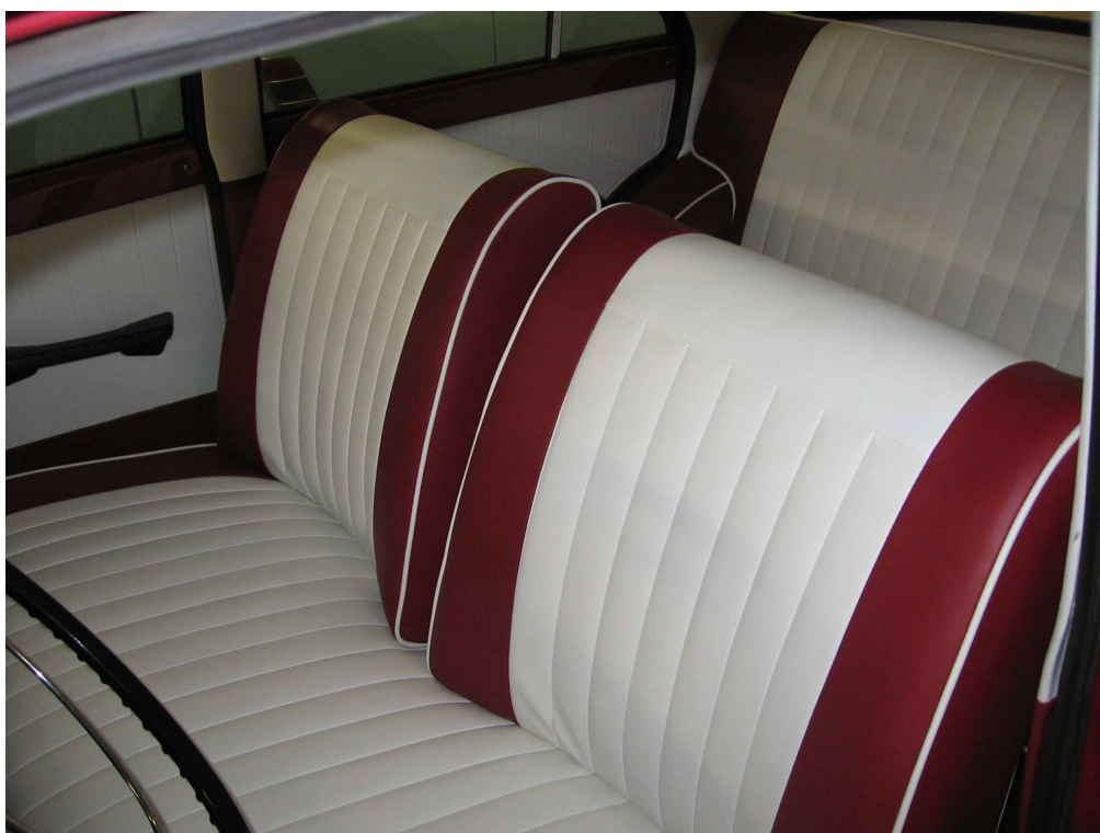
Vaade sõiduki istmetele (polsterdusele)