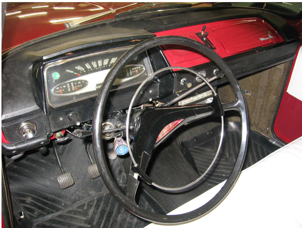
Vaade sõiduki armatuurlaule ja juhtimisseadmetele