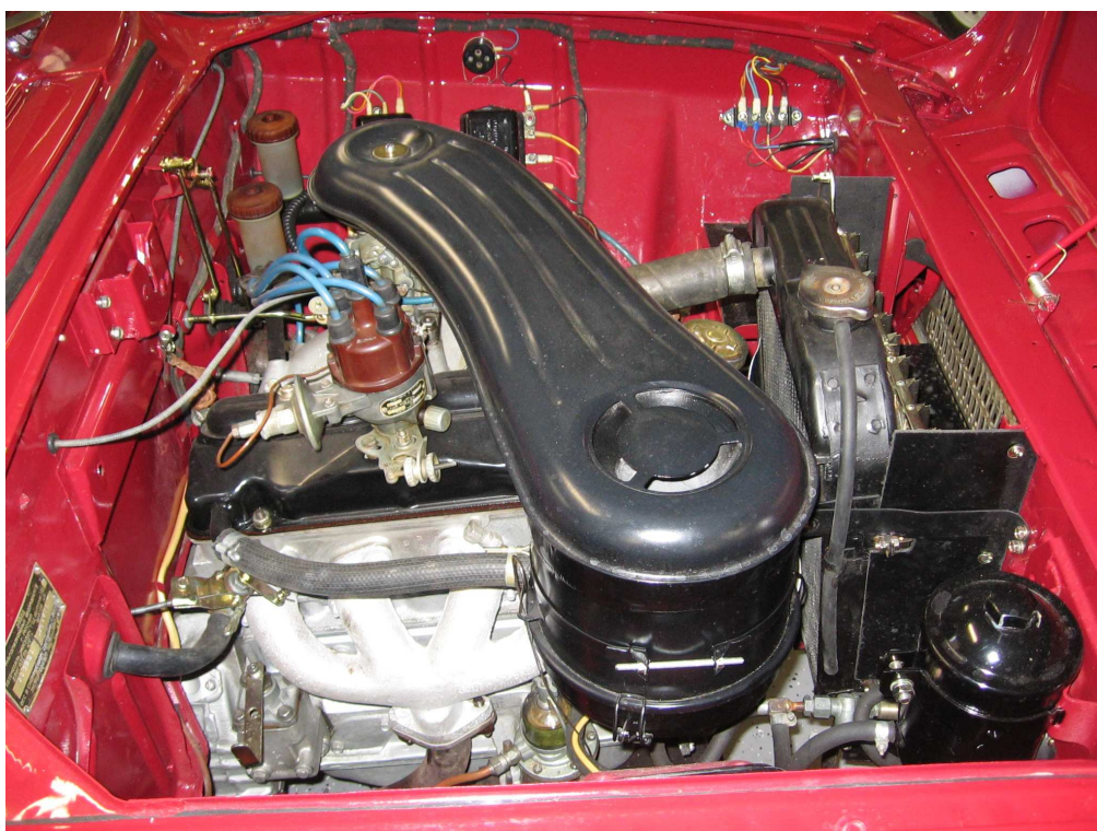
Vaade mootoriruumile vastassuunast