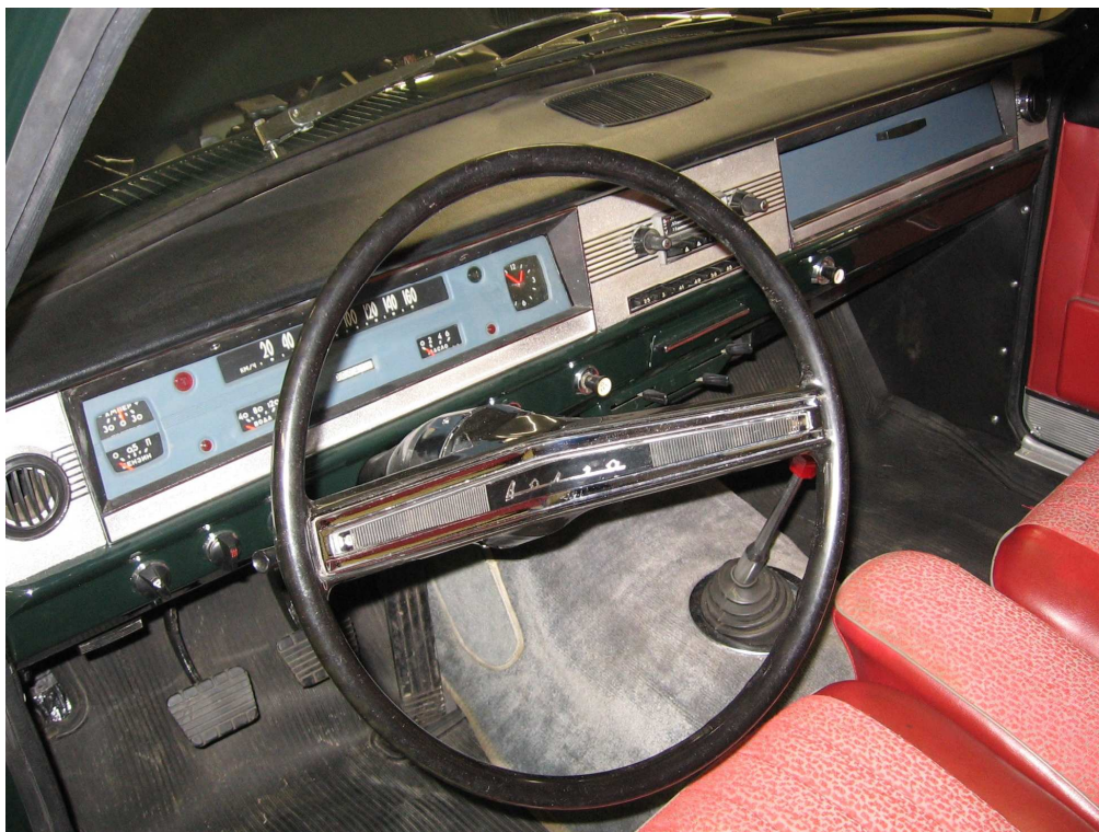
Vaade sõiduki armatuurlaualle ja juhtimisseadmetele