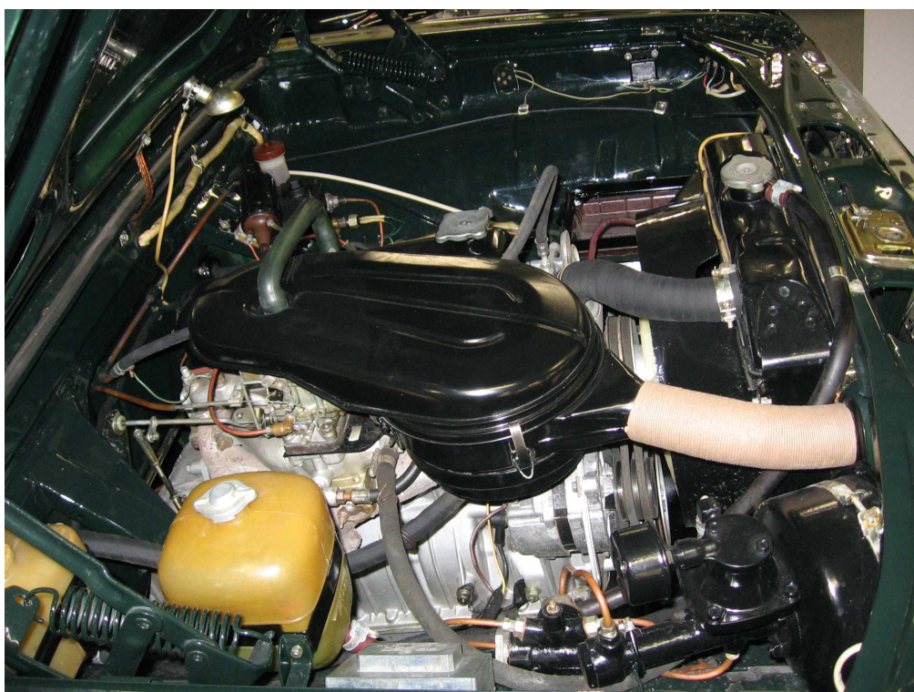
Vaade mootoriruumile vastassuunast