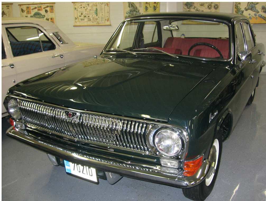
Diagonaalvaade esiosale ja vasakule küljele