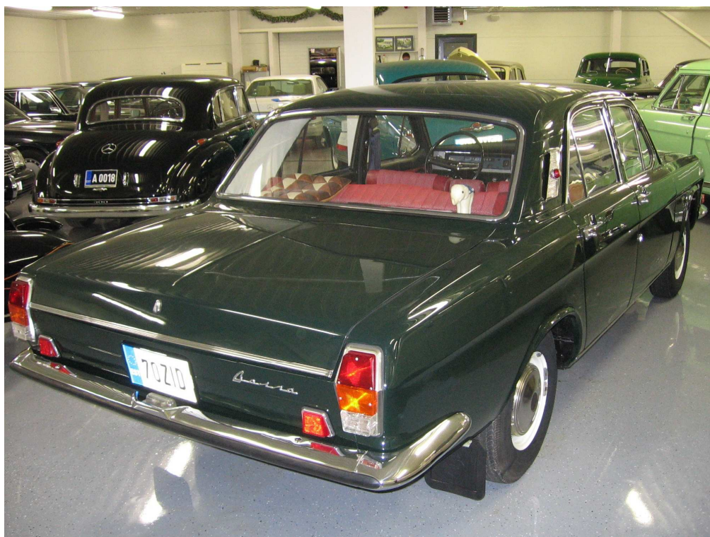
Diagonaalvaade tagaosale ja paremale küljele