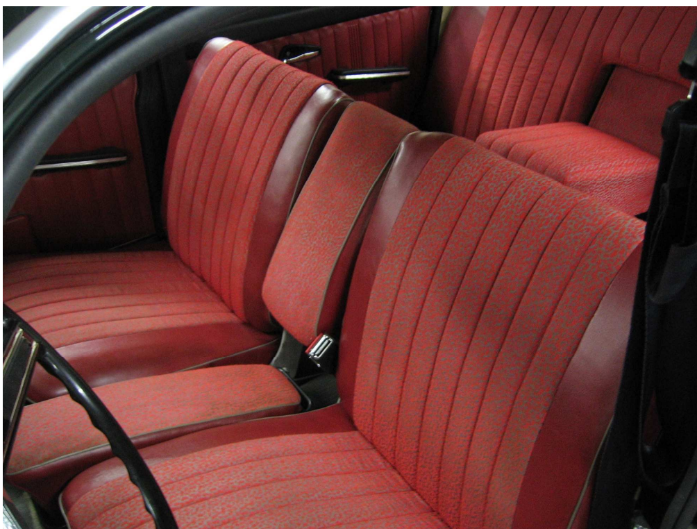
Vaade sõiduki istmetele (polsterdusele)