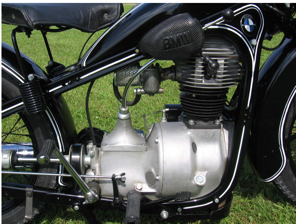
Vaade mootorile teiselt küljelt