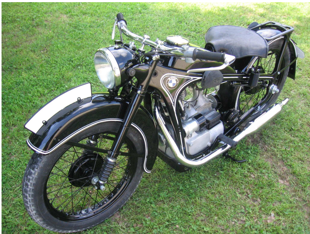
Diagonaalvaade esiosale ja vasakule küljele