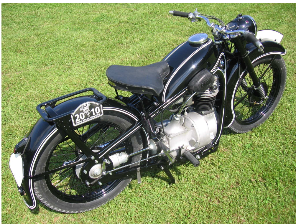
Diagonaalvaade tagaosale ja paremale küljele