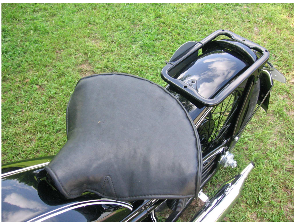
Vaade sõiduki istme(te)le