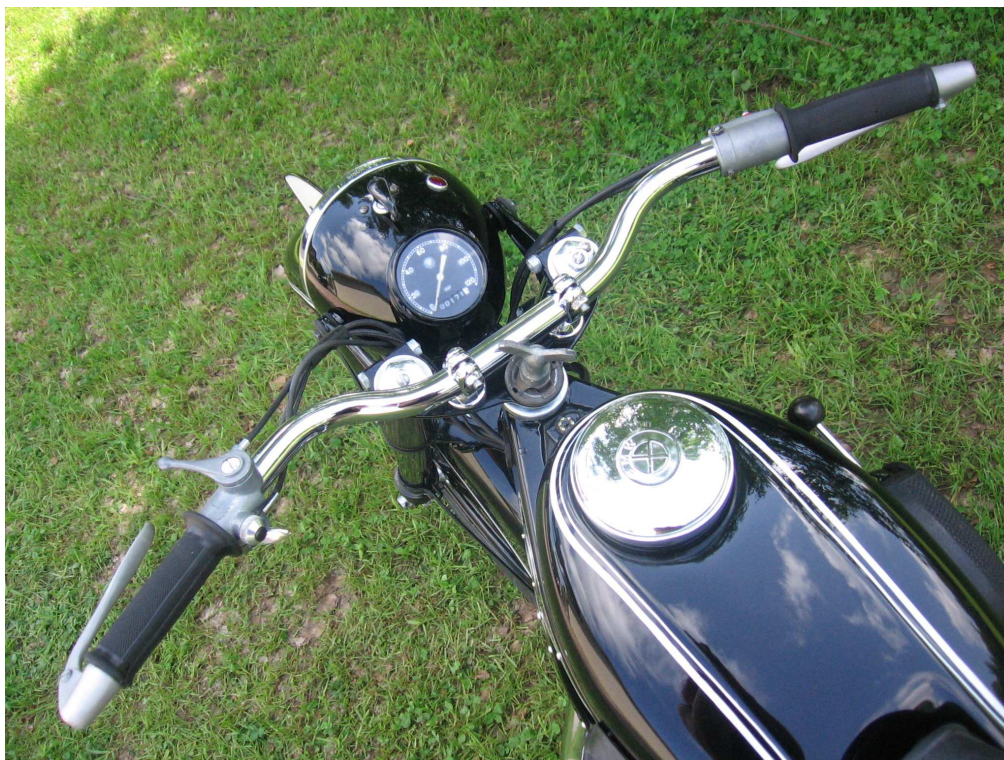
Vaade sõiduki juhtimisseadmetele