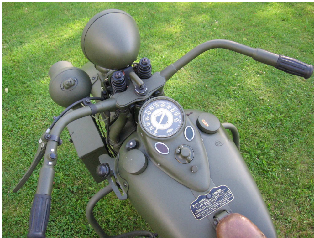
Vaade sõiduki juhtimisseadmetele