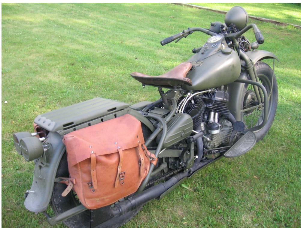
Diagonaalvaade tagaosale ja paremale küljele