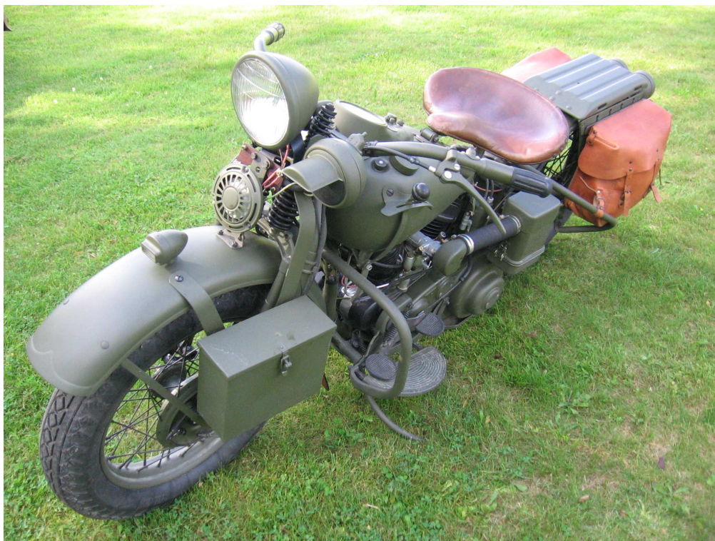
Diagonaalvaade esiosale ja vasakule küljele