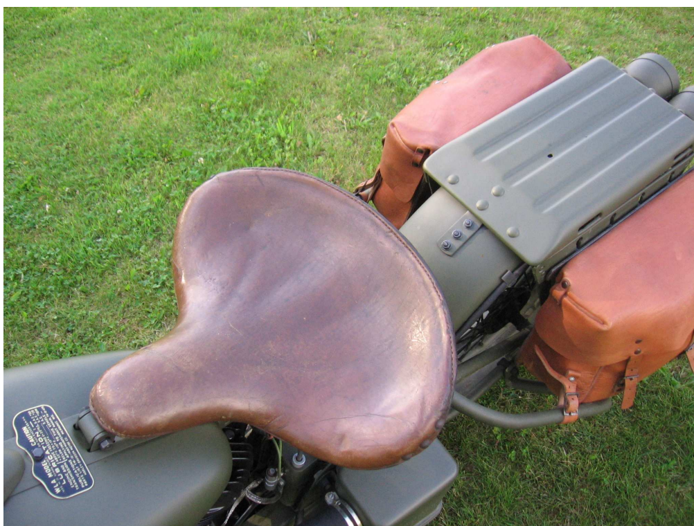
Vaade sõiduki istme(te)le