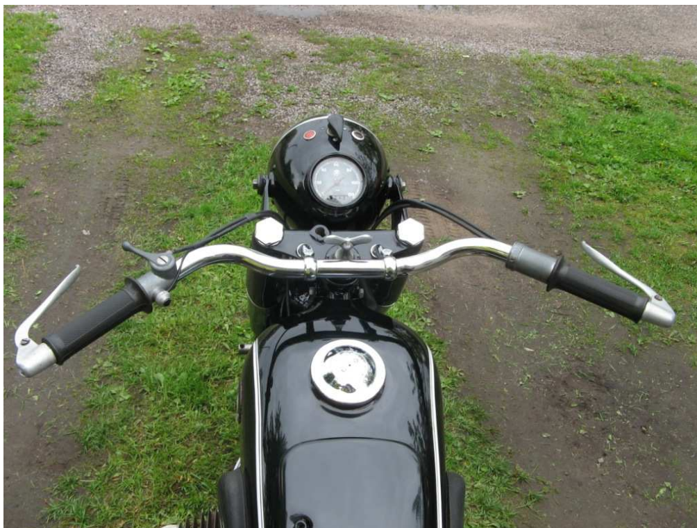
Vaade sõiduki juhtimisseadmetele