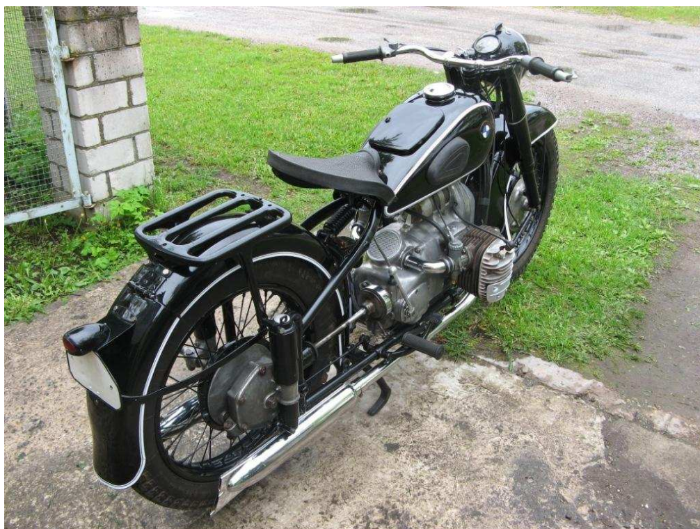
Diagonaalvaade tagaosale ja paremale küljele