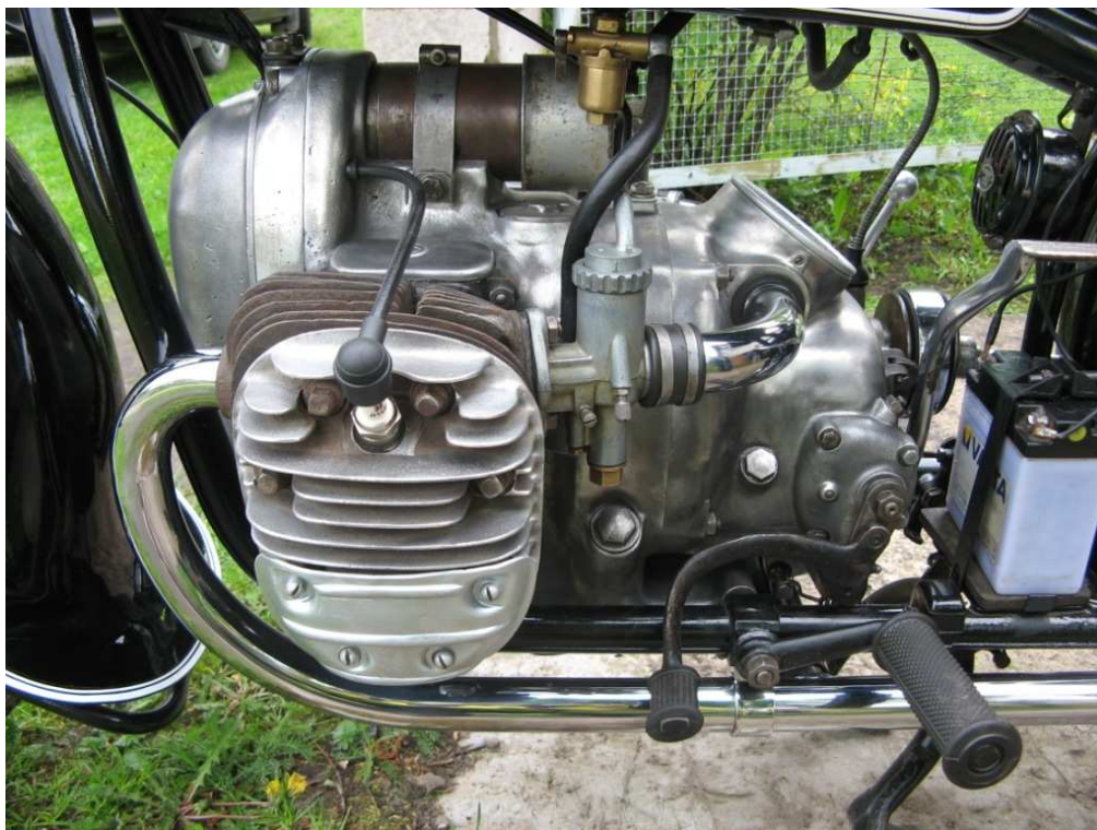
Vaade mootorile ühelt küljelt