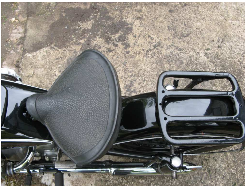
Vaade sõiduki istme(te)le