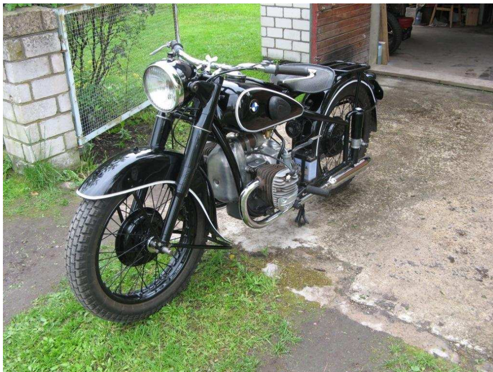
Diagonaalvaade esiosale ja vasakule küljele