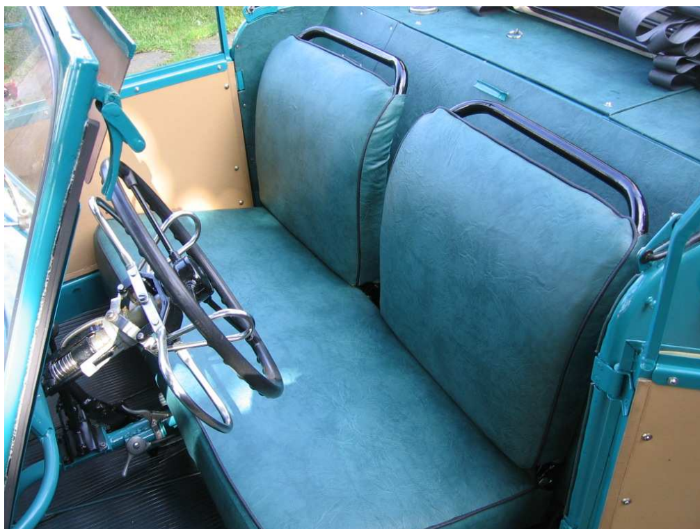
Vaade sõiduki istmetele (polsterdusele)