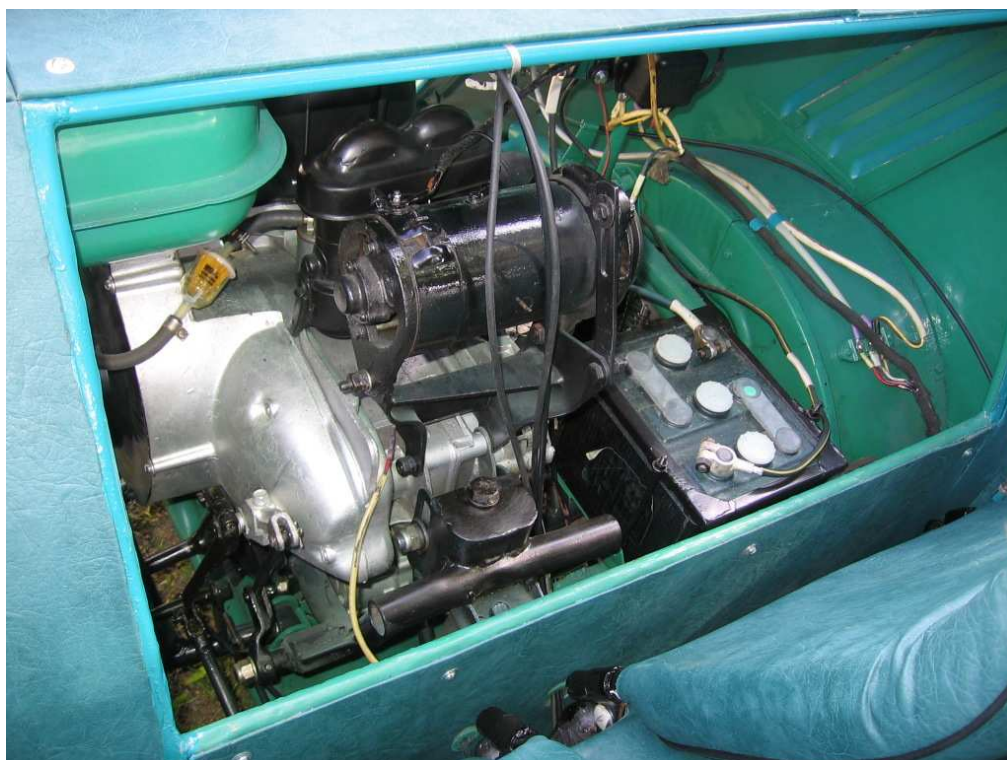
Vaade mootoriruumile vastassuunast