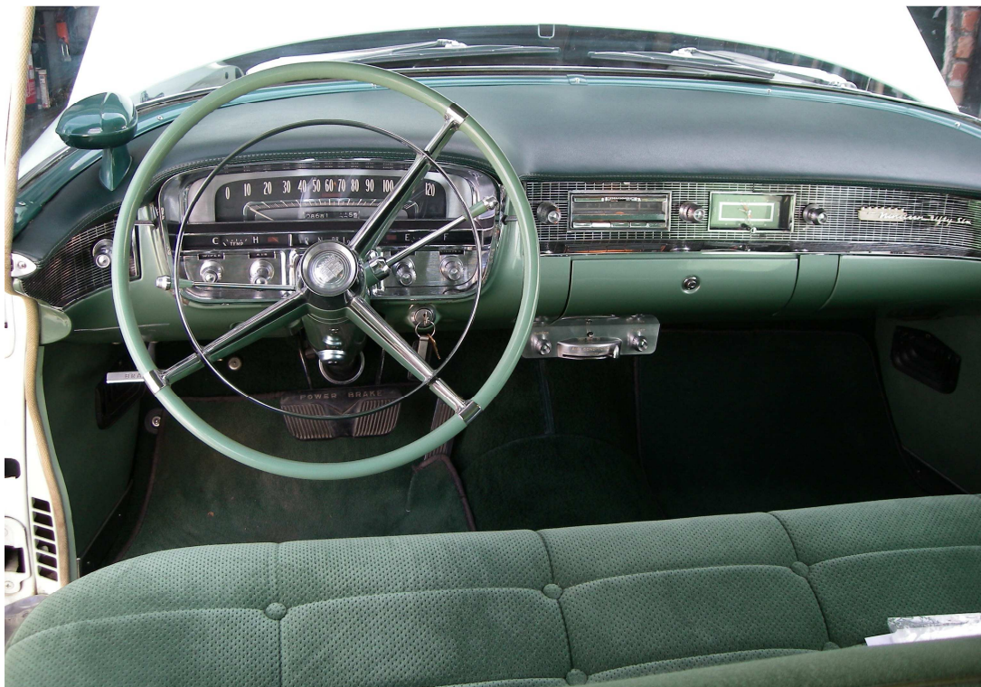
Vaade sõiduki armatuurlaualle ja juhtimisseadmetele