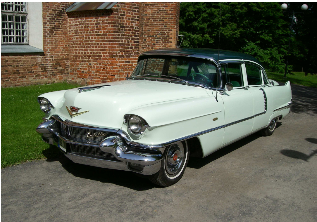
Diagonaalvaade esiosale ja vasakule küljele