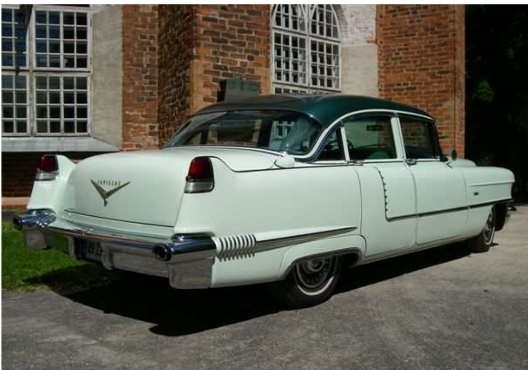
Diagonaalvaade tagaosale ja paremale küljele