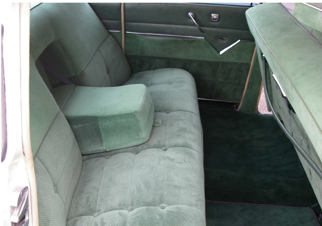
Vaade sõiduki istmetele (polsterdusele)