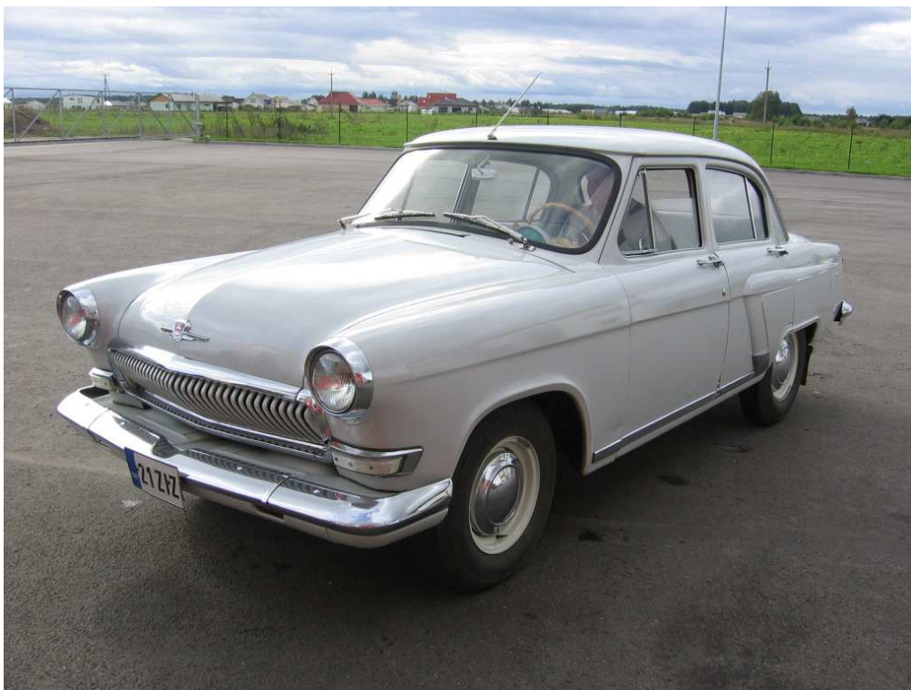
Diagonaalvaade esiosale ja vasakule küljele