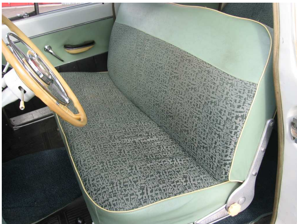
Vaade sõiduki istmetele (polsterdusele)