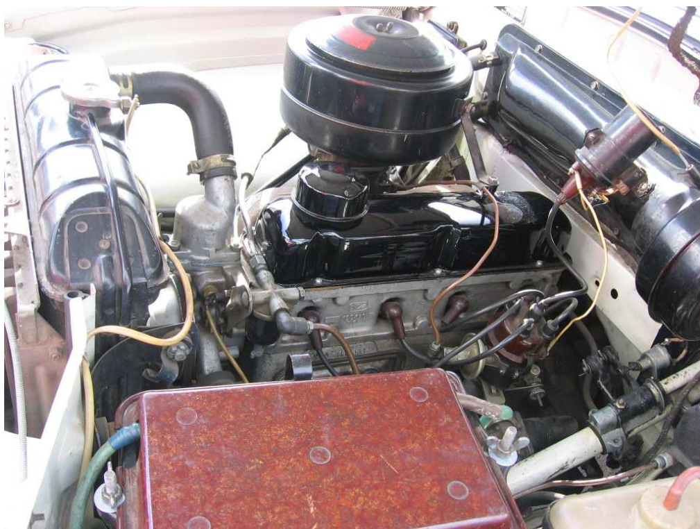
Vaade mootoriruumile vasakult või sõltuvalt mootoriruumi katte paigutusest muust suunast