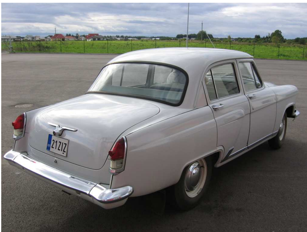
Diagonaalvaade tagaosale ja paremale küljele