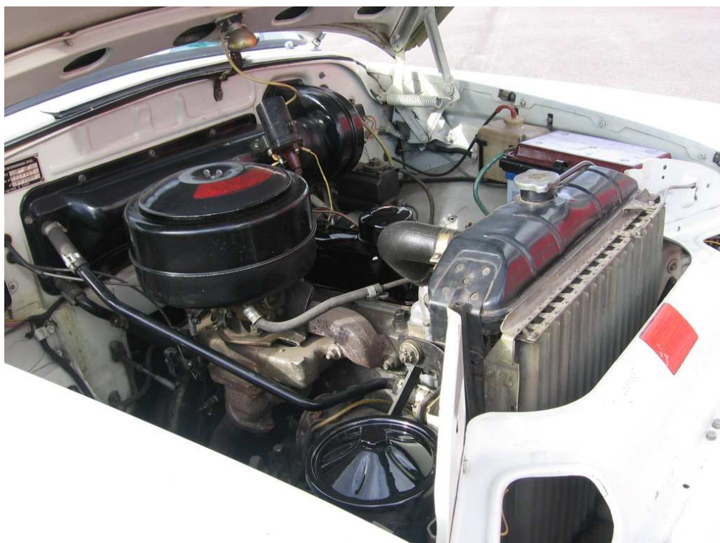
Vaade mootoriruumile vastassuunast