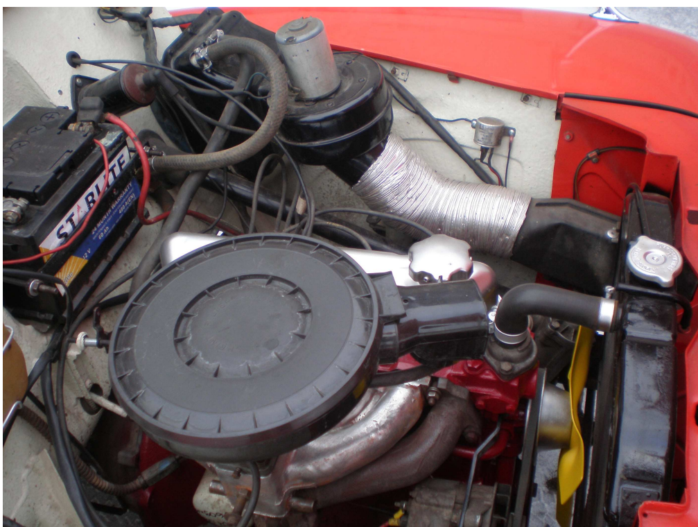
Vaade mootoriruumile vastassuunast