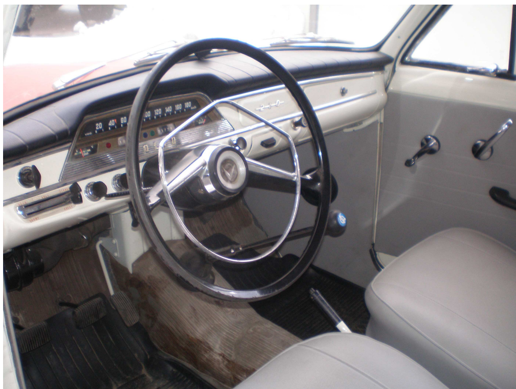
Vaade sõiduki armatuurlaualle ja juhtimisseadmetele