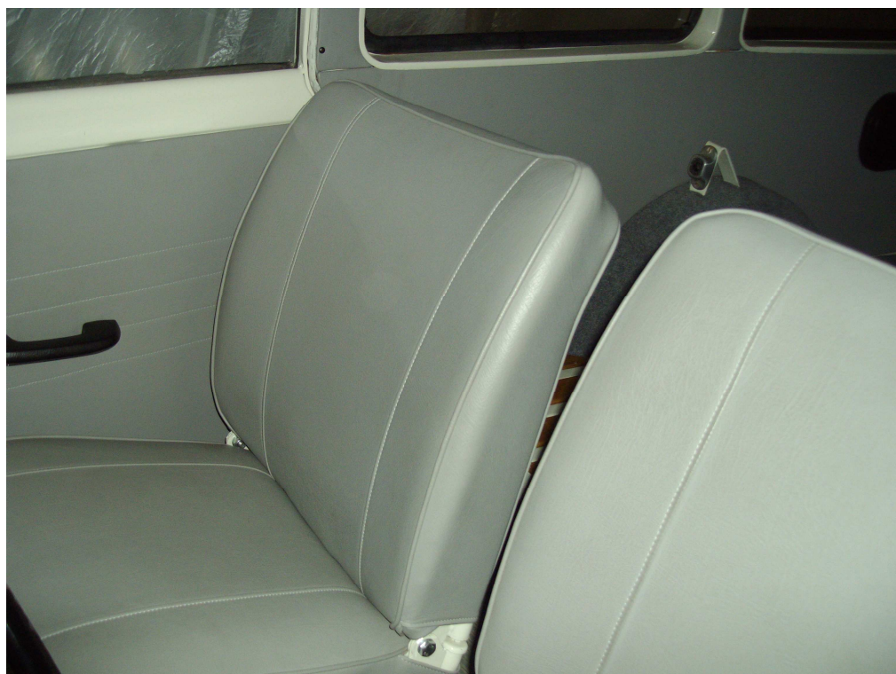
Vaade sõiduki istmetele (polsterdusele)