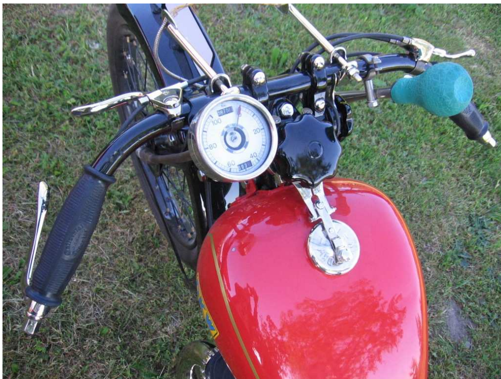
Vaade sõiduki juhtimisseadmetele