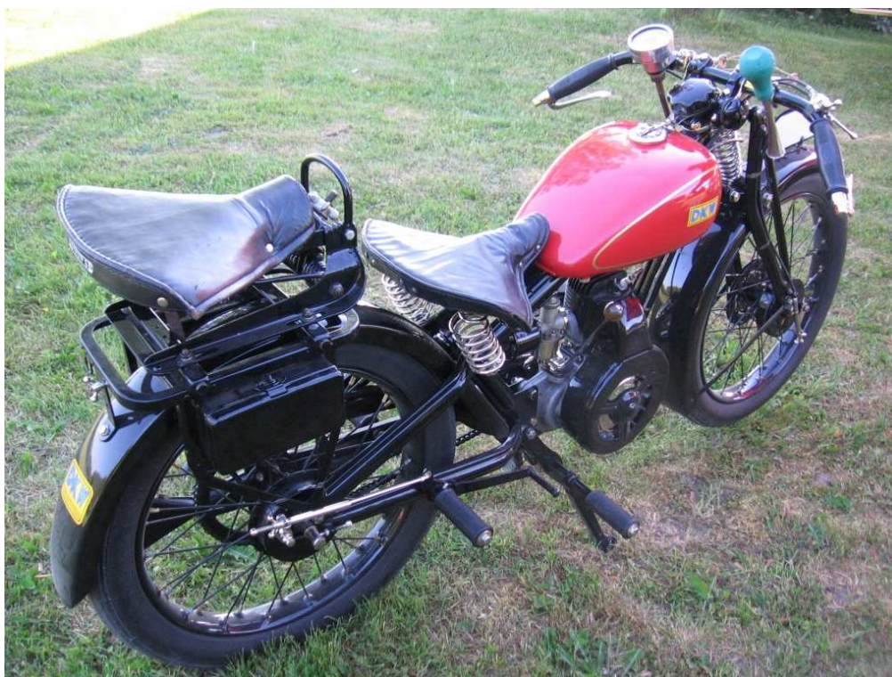
Diagonaalvaade tagaosale ja paremale küljele