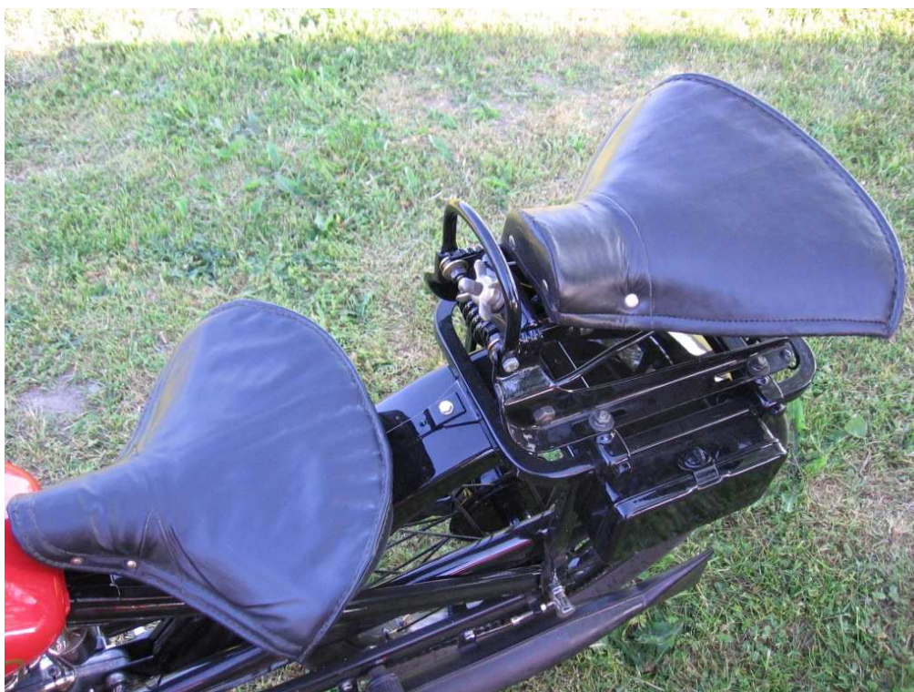
Vaade sõiduki istme(te)le