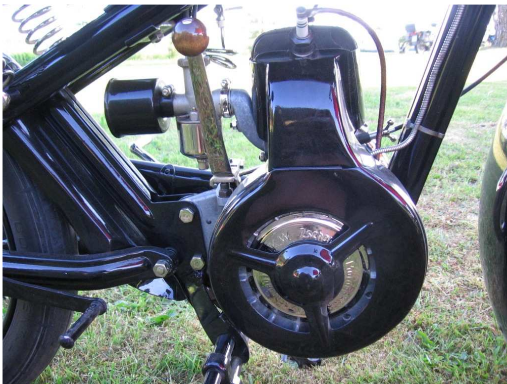
Vaade mootorile teiselt küljelt