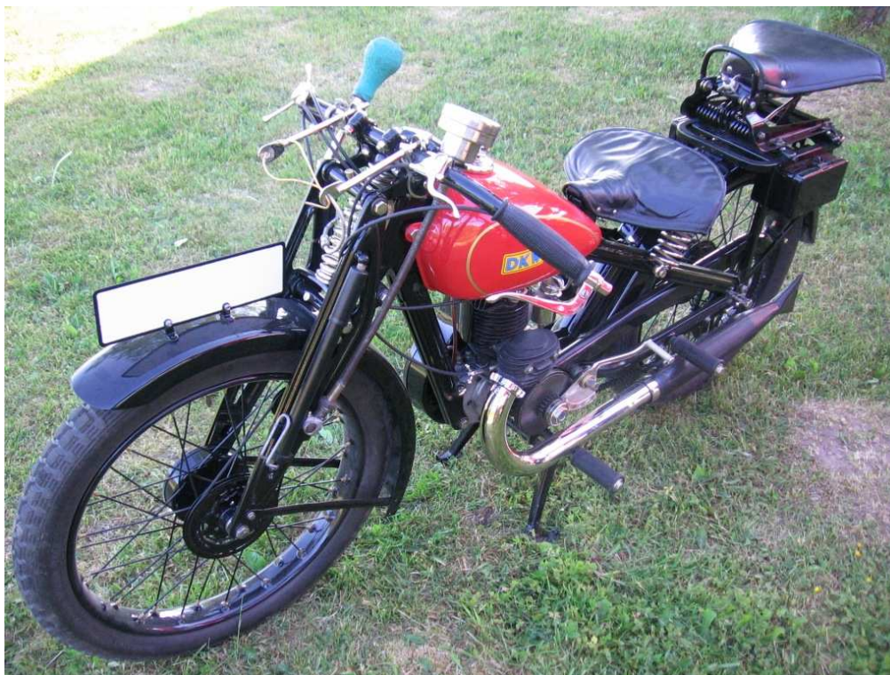
Diagonaalvaade esiosale ja vasakule küljele