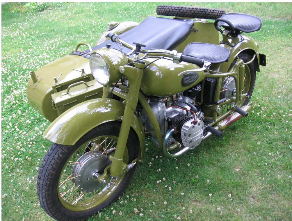
Diagonaalvaade esiosale ja vasakule küljele