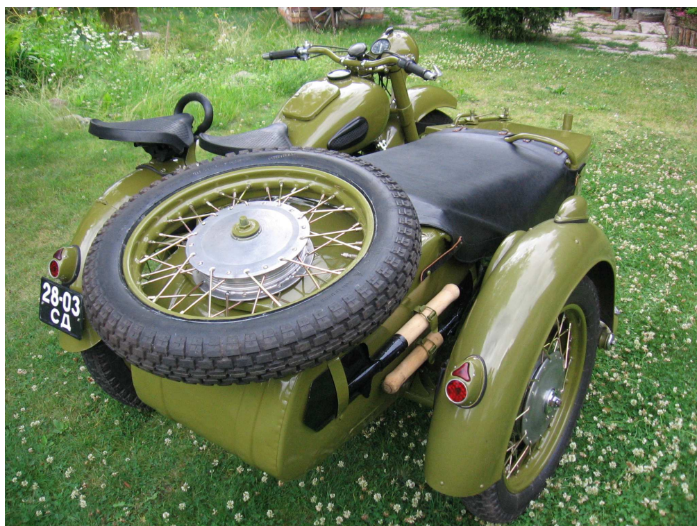
Diagonaalvaade tagaosale ja paremale küljele