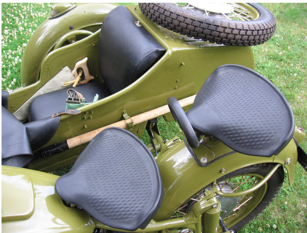
Vaade sõiduki istme(te)le