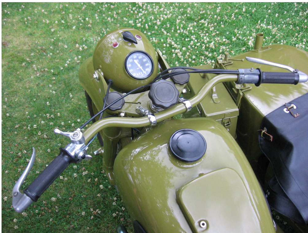
Vaade sõiduki juhtimisseadmetele