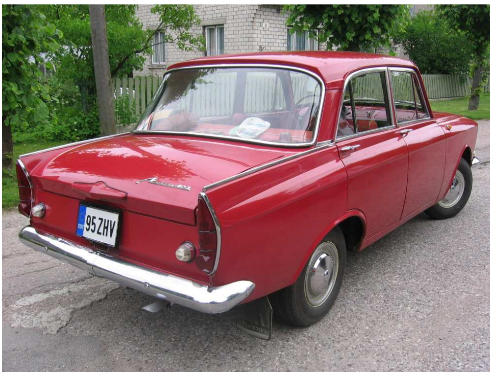
Diagonaalvaade tagaosale ja paremale küljele