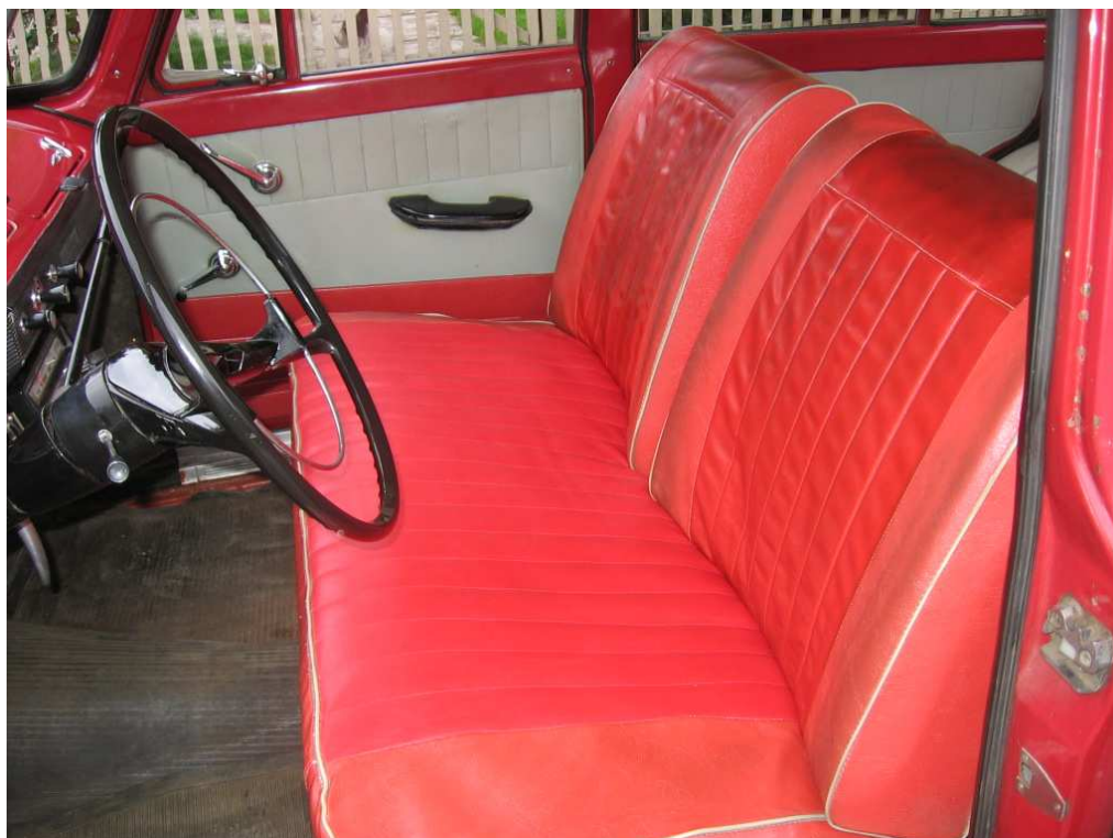
Vaade sõiduki istmetele (polsterdusele)