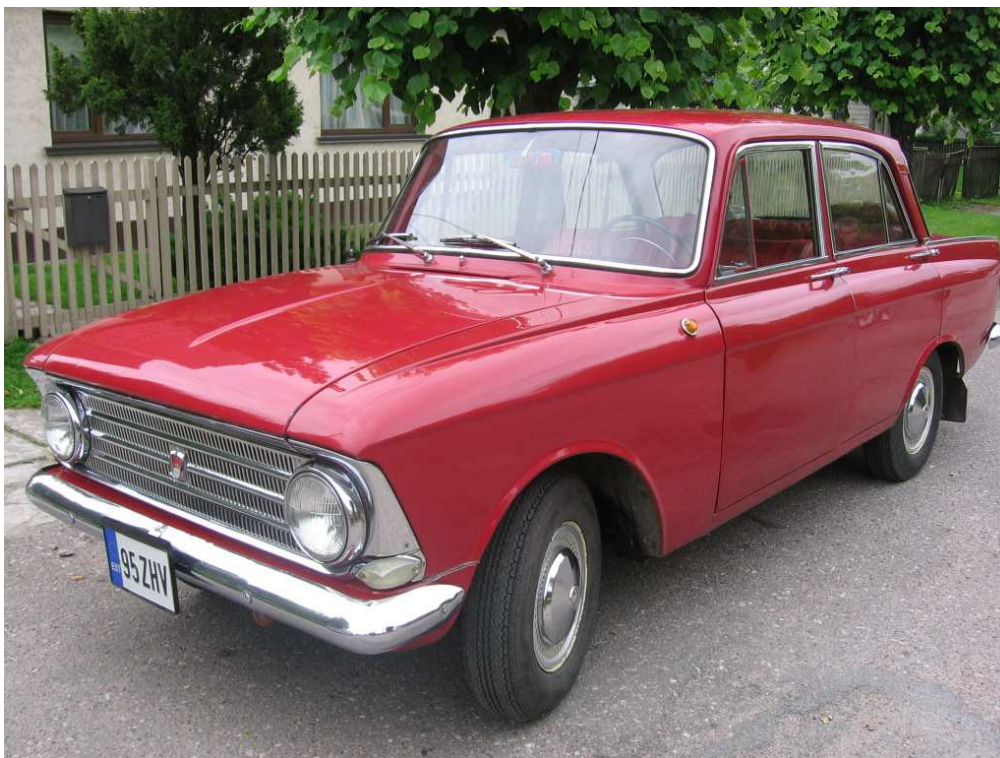
Diagonaalvaade esiosale ja vasakule küljele