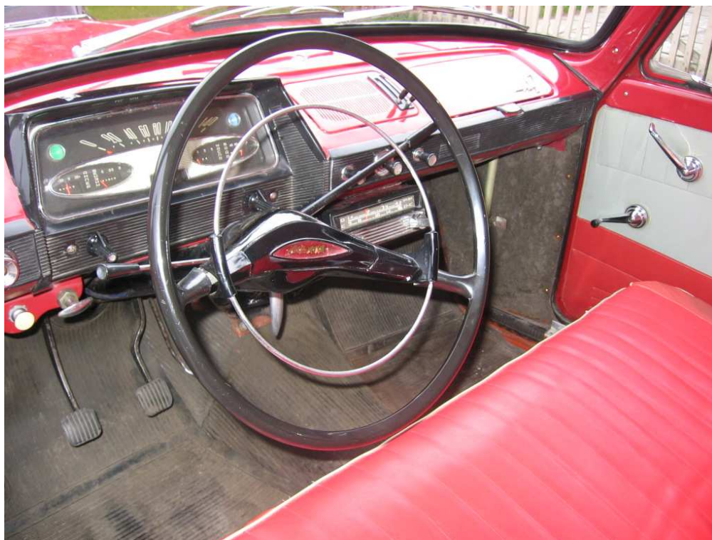
Vaade sõiduki armatuurlaualale ja juhtimisseadmetele